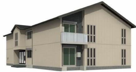
※画像は完成イメージです

オートロック, モニタ付オートロック, 角住戸, 玄関ホール, 電子キー, 電子ロック, 陽当たり良好, 閑静な住宅街, 防犯カメラ, 緑豊かな住宅地, 平置駐車場, 舗装駐車場, 周辺交通量少なめ